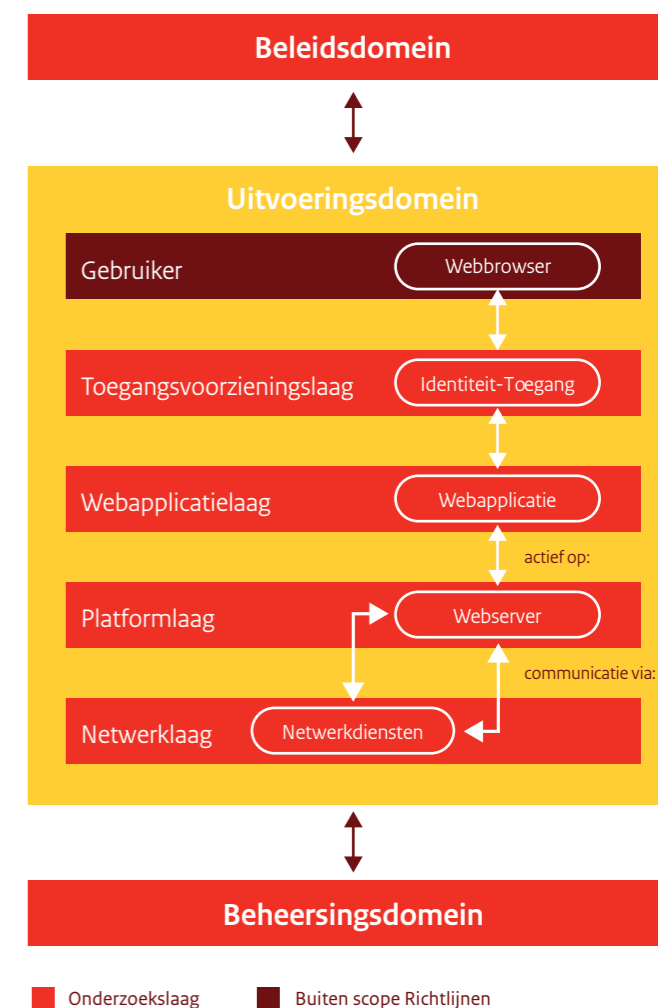
Figuur 2. Indeling van de beveiligingsrichtlijnen

De beveiligingsrichtlijnen zijn, naar de gelijknamige domeinen, georganiseerd in drie hoofdstukken: beleidsdomein, uitvoeringsdomein en control- of beheersingsdomein. Deze indeling komt voort uit het SIVA-raamwerk. Figuur 2 geeft de indeling van de richtlijnen.